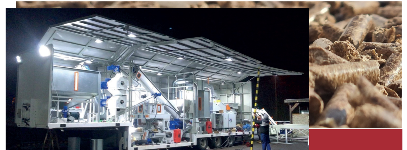
MOBILE PELLETPRODUKTION MIT EINER LEISTUNG BIS 2.000 kg/h